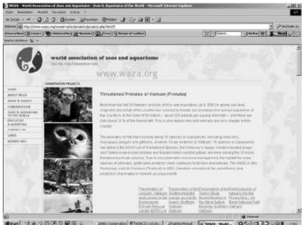
Imagen de los proyectos de conservación de WAZA, en este caso se trata del proyecto Na Hang, Cuc Phuong y Cat Ba del Zoo de Munich (Proyectos de WAZA Nrs. 04007, 04008 and 04009), y del proyecto Phong Na - Khe Bang del Zoo de Colonia (Proyecto WAZA Nr.04015), ambos disponibles a través de www.waza.org