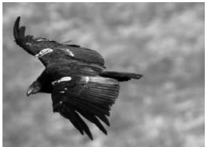
El cóndor de California ( Gymnogyps californianus ), especie críticamente amenazada, fue criada en zoológicos de la AZA y retornada con éxito a la naturaleza.

La Species Survival Commission de la IUCN dispone de una red de grupos de especialistas encargados de tratar con grupos taxonómicos particulares y ayudar al establecimiento de prioridades para actividades de conservación.