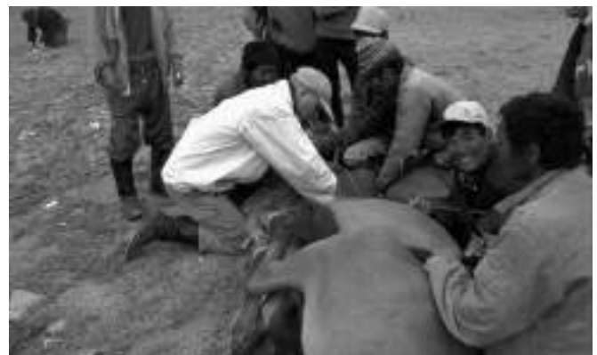
Proyecto WAZA 03002: obtención de muestras de sangre de caballos de Przewalski's ( Equus przewalskii ) reintroducidos en Gobi B, Mongolia.

Esta última área puede tener un doble beneficio: ayudar a ampliar el acuerdo sobre las prioridades de investigación a nivel institucional, regional y/o global y ayudar a entrenar a los futuros biólogos de la vida salvaje.