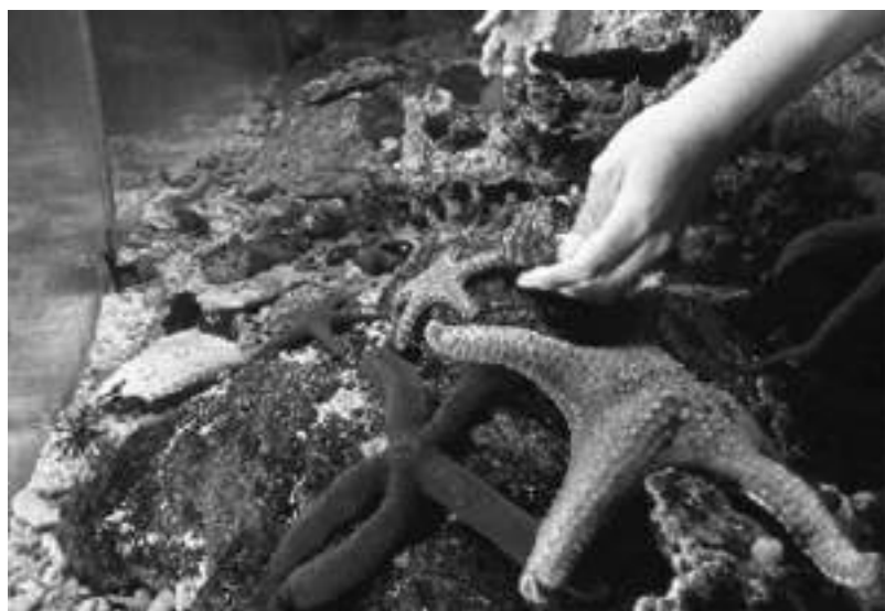
Ismerkedés egy másik világgal – tengericsillag-simogató. A fotót Kevin Tanner, Underwater World, Mooloolaba, Ausztrália bocsájtotta rendelkezésünkre

Xie Zhong , Chinese Association of Zoological Gardens, China.