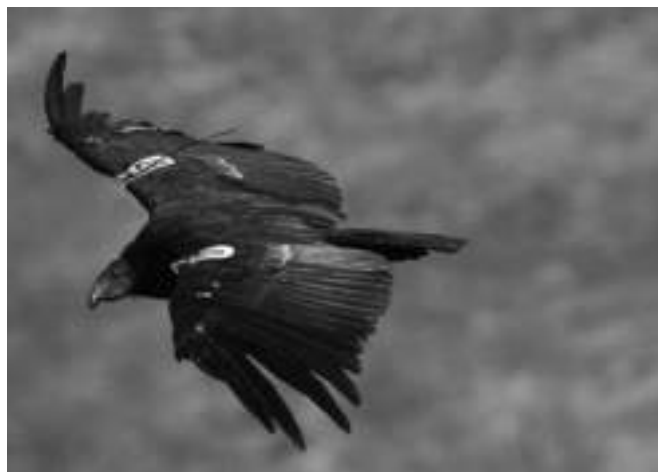
Az SSP, azaz a Faj Túlélési Terv védjegye alatt az AZA (Amerikai Állatkertek Szövetsége) állatkertjeiben tenyésztett, kritikusan veszélyeztetett kaliforniai kondor ( Gymnogyps californianus ) sikeresen visszatért a vadonba.

A globális programok létrejöttével maximalizálható a gyűjteményi populációk kezelési hatékonysága, kiszűrhető az egymásnak esetlegesen ellentmondó vagy akár konkuráló célok, a területek együttműködésére javaslatok tehetőek. Például regionális programok létesítésére tett erőfeszítések kerülhetnek veszélybe, ha hirtelen kiderül, hogy a genetikailag fontos állatokat egy másik regionális prog-