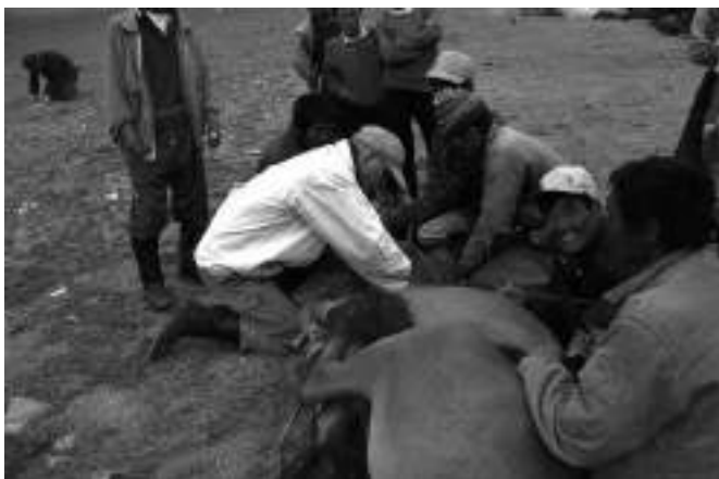
03002. sz. WAZA Projekt: Vérminta vétele visszatelepített Przewalski lóból ( Equus przewalski ) a Góbi B Nemzeti Parkban, Mongóliában.

Ez utóbbi területnek kettős haszna lehet: egyrészt az intézmény által vagy regionálisan és/vagy globálisan felállított kutatási prioritásokhoz lehet támogatást talán, másrészt a jövő kutató biológusainak képzésébe kapcsolódhat így az intézmény.