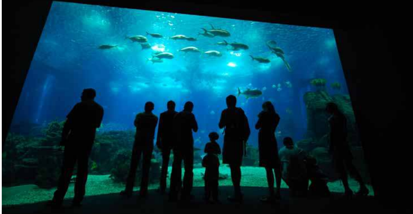
Aquário central. Oceanário de Lisboa.