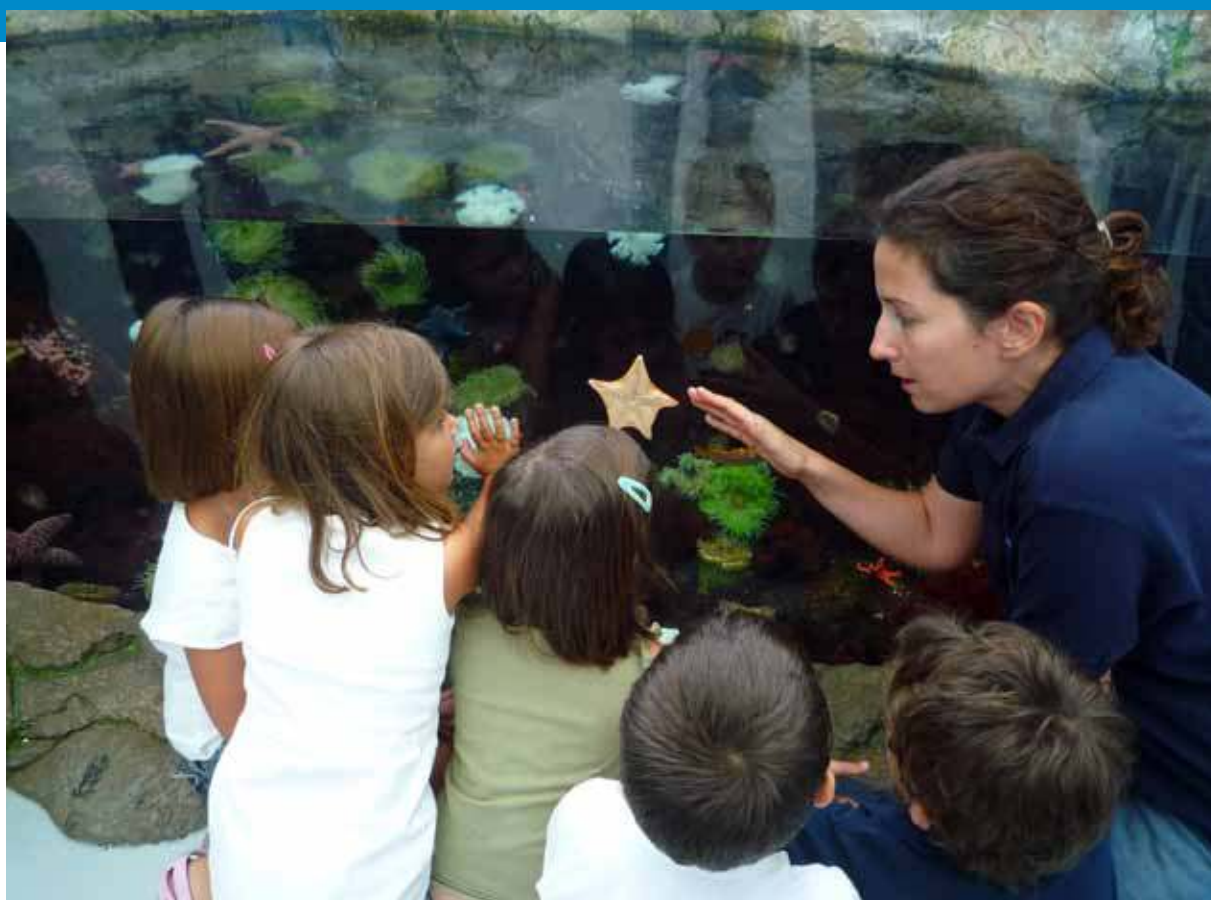
Programa de Educação. Oceanário de Lisboa.