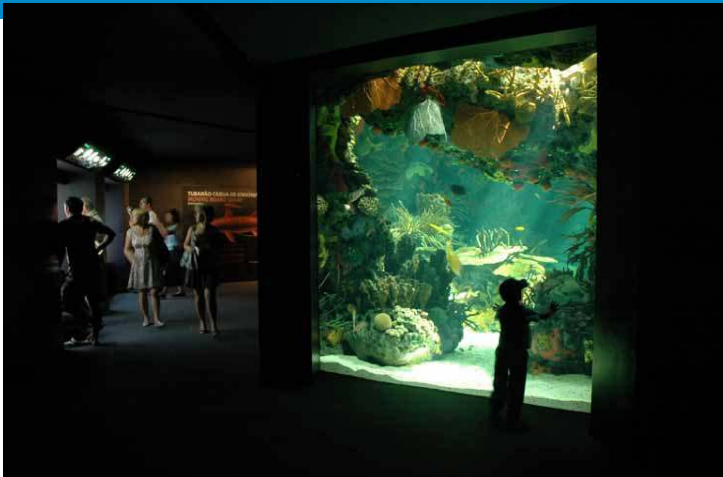
Vista subaquática do habitat do Índico tropical. Oceanário de Lisboa.