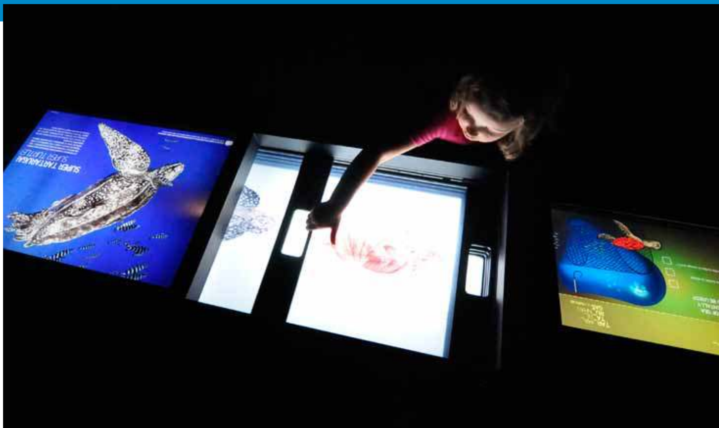
Exposição temporária "Tartarugas marinhas. A viagem.". Oceanário de Lisboa.