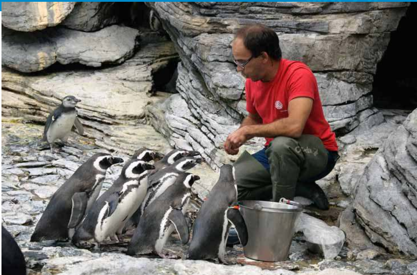
Aquarista alimenta pinguins-de-Magalhães. Oceanário de Lisboa.