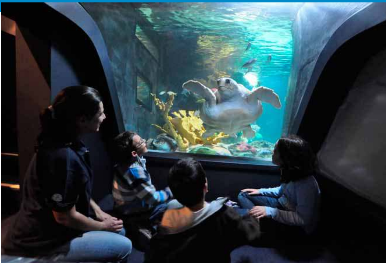
Exposição temporária "Tartarugas marinhas. A viagem.". Oceanário de Lisboa.

Muitas personalidades internacionalmente respeitadas de aquários públicos fizeram contribuições significativas para o documento original da WZACS (2005). No entanto, há muito que foi reconhecido que, juntamente com muitos aspetos em comum, existem diferenças entre aquários e zoos: na sua natureza, carácter, constituição típica, requisitos operacionais, na sua comunidade de partes interessadas, e nos desafios que enfrentam em matéria de conservação e sustentabilidade ambiental para o ambiente aquático ou de zonas húmidas. Assim, decidiu-se que era necessária uma publicação especializada – preparada por e para profissionais de aquários e parceiros – para detalhar cuidadosamente a implementação da WZACS por aquários públicos. Este novo documento estratégico traça o rumo para aquários públicos num mundo em que os recursos marinhos, costeiros e de água doce estão a ser cruelmente explorados, em que a biodiversidade associada à água está em constante declínio, e em que a gestão cuidadosa de todos os ecossistemas aquáticos é agora crucial para o bem-estar do planeta. Em suma, o presente documento Virar a Maré é a resposta completa da Comunidade de Aquários WAZA à WZACS.