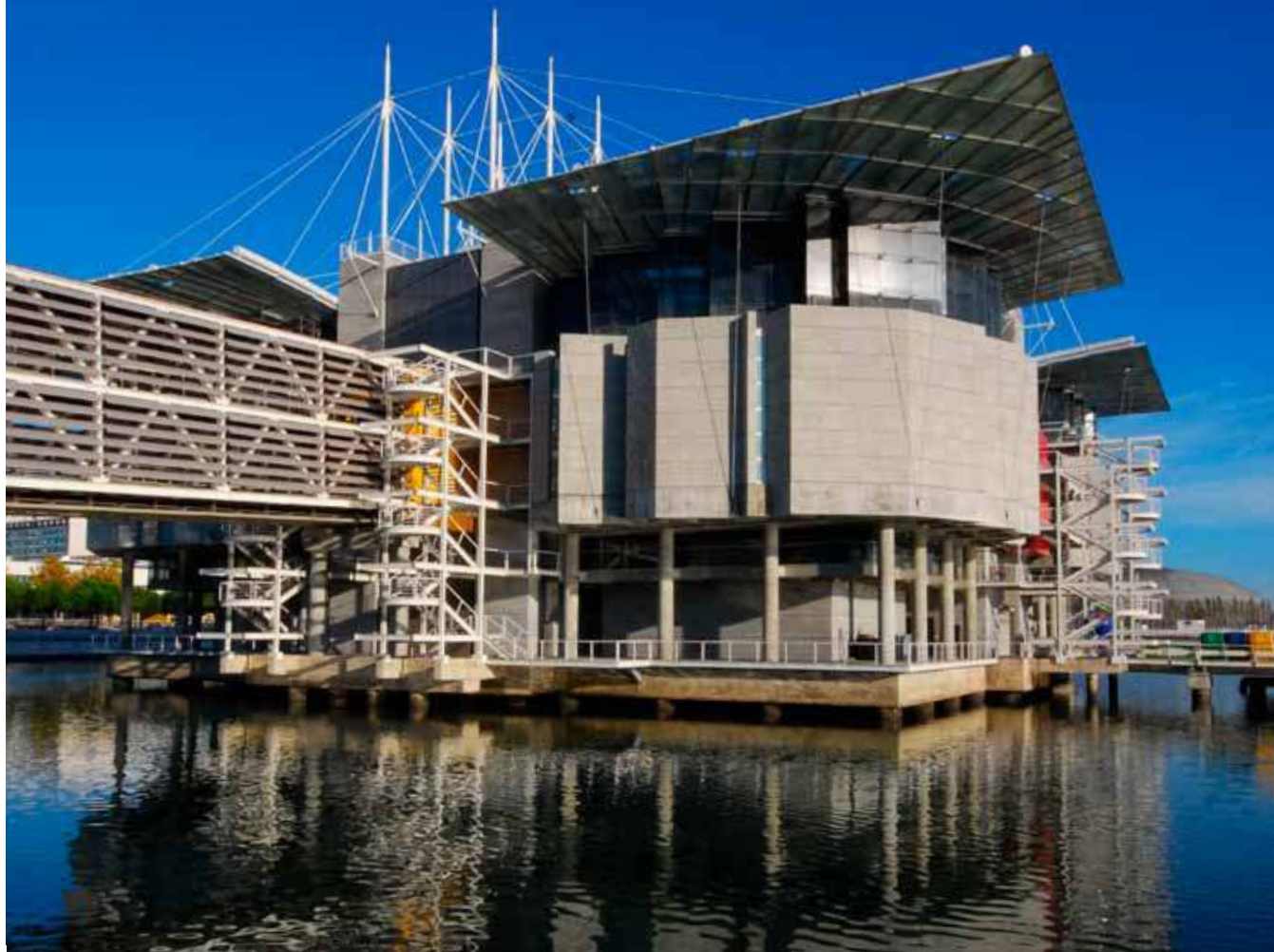
Edifício dos Oceanos. Oceanário de Lisboa.