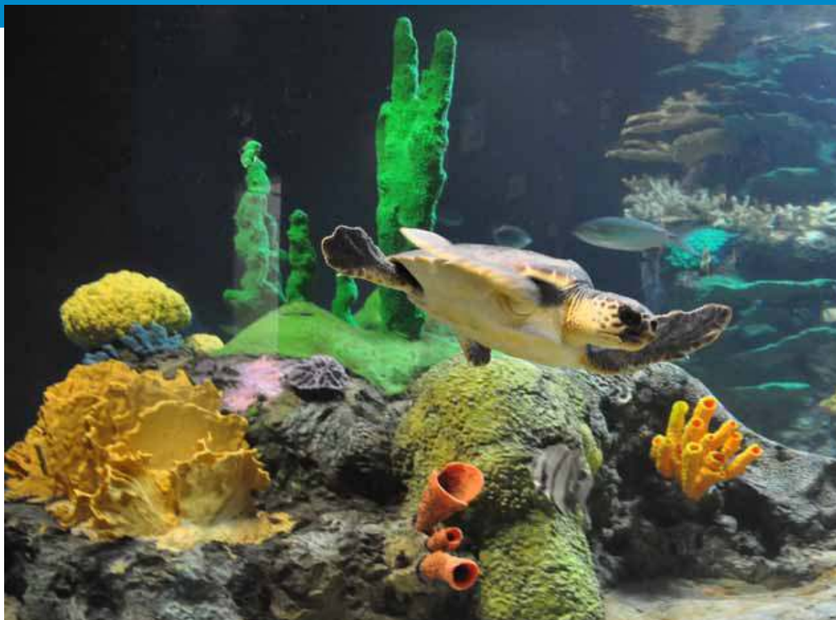
Exposição temporária "Tartarugas marinhas. A viagem.". Oceanário de Lisboa.

A criação do – Amphibian – Ark AArk, pela WAZA e pelos Grupos de Especialistas em Anfíbios e Reprodução para a Conservação da IUCN SSC ( Amphibian and Conservation Breeding Specialist Groups ) é outro exemplo de uma iniciativa global de um zoo, aquário, jardim botânico, museu da natureza e de outros parceiros para lidar com uma crise de extinção (ver www.amphibianark.org ). Os aquários públicos responsáveis dentro da comunidade WAZA, desempenham agora um papel crucial no avanço das iniciativas em matéria de conservação e sustentabilidade. A própria WAZA está ativa no desenvolvimento de políticas internacionais e na promoção da conservação e sustentabilidade e esteve representada no Congresso de Conservação Mundial da IUCN em Barcelona. Aqui, a WAZA copatrocinou com sucesso as seguintes moções de relevância para a vida aquática: CGR4.MOTO21 – Parar a crise dos anfíbios; CGR4.MOTO23 – O Congresso Mundial de Espécies; CGR4.MOTO33 – Um Plano Europeu de Ação Eficaz para Tubarões; CGR4.MOTO34 – Conservação de tubarões migratórios e oceânicos; CGR4.MOTO54 – Colaboração intercomissões para o uso sustentável dos recursos biológicos.