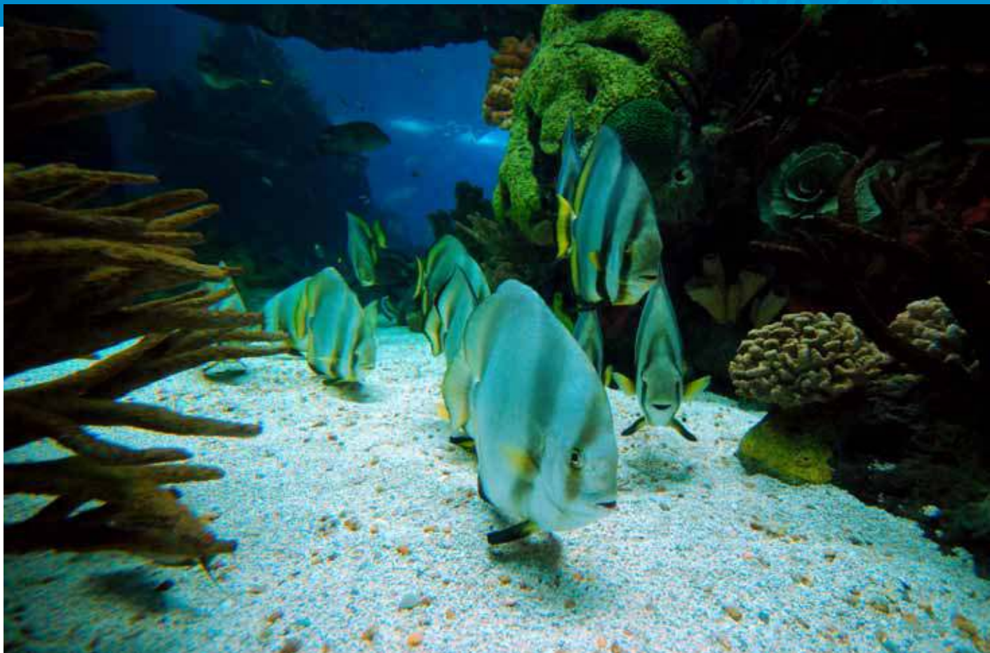
Peixe-morcego-redondo, Platax orbicularis . Oceanário de Lisboa.