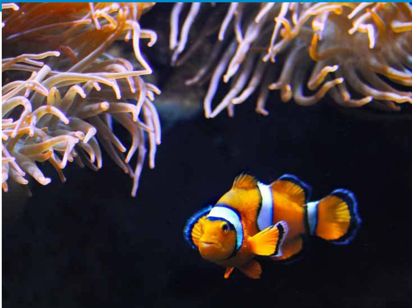
Peixe-palhaço, Amphiprion ocellaris . Oceanário de Lisboa.